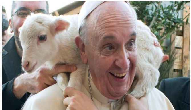
Orędzie Papieża Franciszka na 55 Światowy Dzień Modlitw o Powołania.

Niech Najświętsza Maryja Panna, młoda niewiasta z prowincjonalnego Nazaretu, która usłyszała, przyjęła i żyła Słowem Boga, które stało się ciałem, zawsze nas strzeże i nam towarzyszy na naszej drodze.