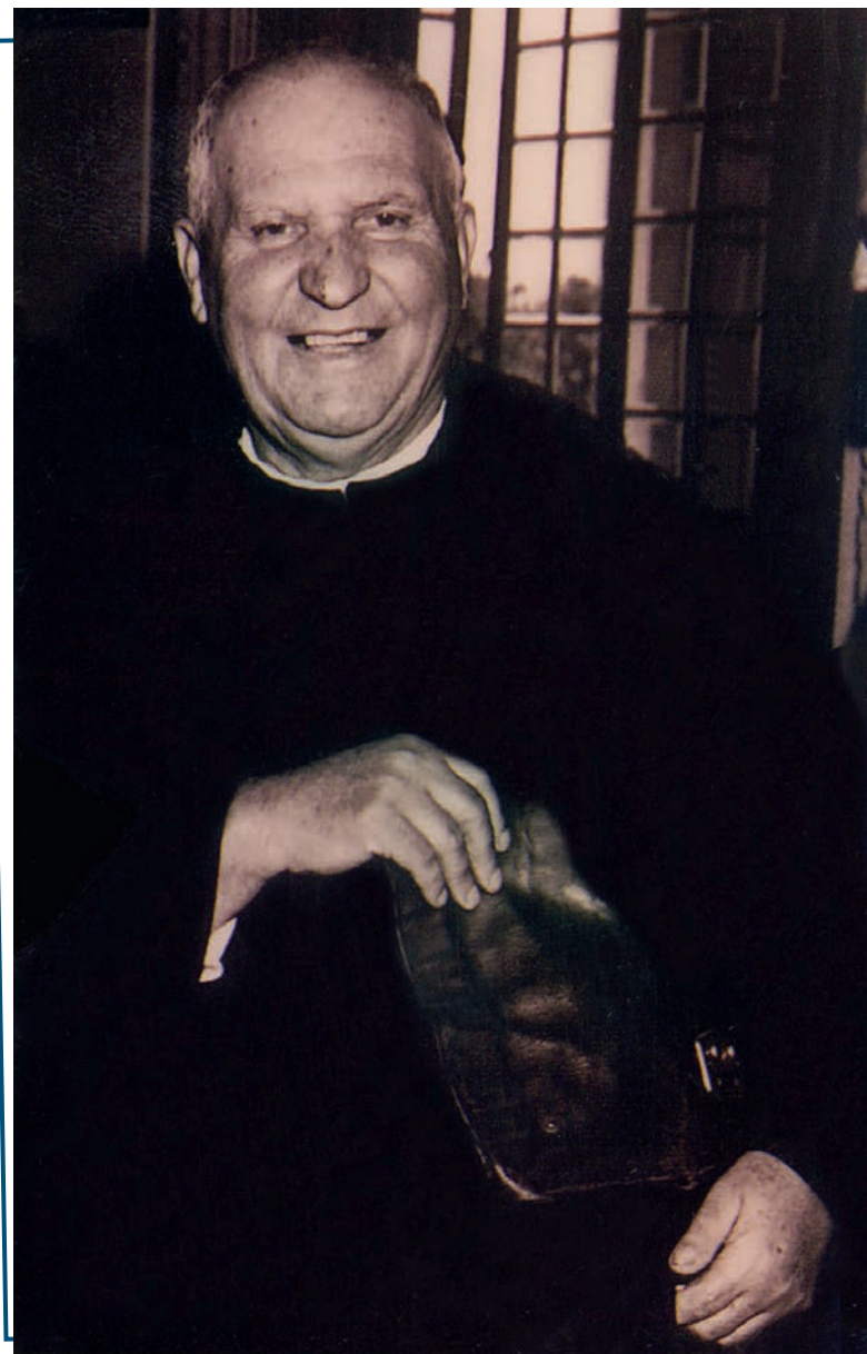
El Hno. Bonifacio Bonillo.

El 8 de marzo de 1550 será para siempre el día que la misericordia entró en el cielo vestida de Juan de Dios. No era extraño. Así había vivido: postrado y alzando en brazos a los cristos vivos que encontró en vida. A su fama de santo hoy, todavía muchos siguen su camino de hospitalidad por todo el mundo.