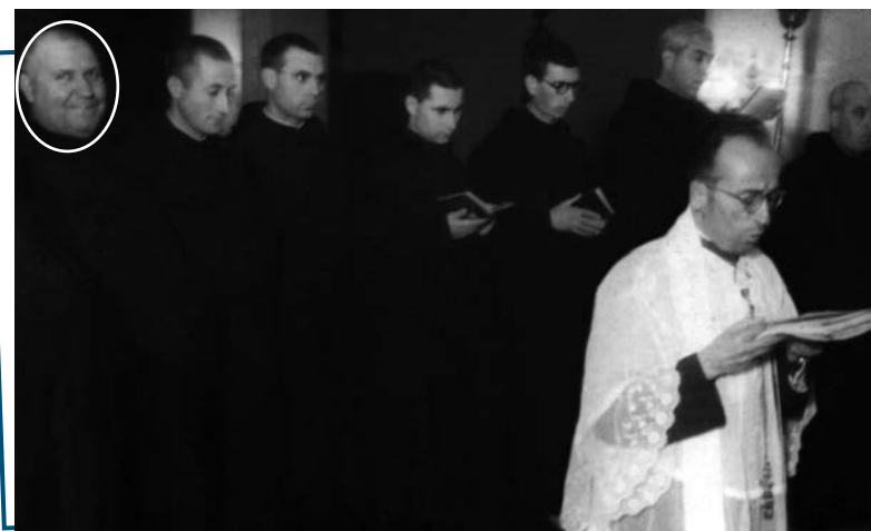
Profesión solemne, 3 de junio de 1929 en la iglesia de la Fundación San José en Carabanchel Alto.

Cuando todavía estaba en Madrid, tuvieron lugar una serie de incendios en iglesias y casas religiosas, divisándose desde las azoteas del asilo las columnas de humo. En una ocasión acudieron de noche treinta soldados del regimiento de Caballería, al mando de un teniente, que venían a defenderlo contra posibles intentos de asaltos o incendio. Los Hermanos que en estas fechas desempeñaban el empleo de li-