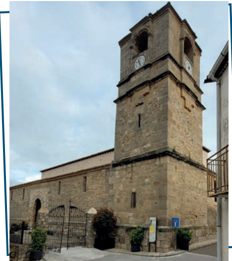
Iglesia Parroquial de Cañaveruelas.