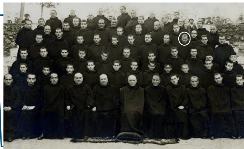
Comunidad de Ciempozuelos 1925.

Y vuelve a Ciempozuelos, donde durante seis meses se dedicará a trabajar directamente con los enfermos mentales, como el resto de los Hermanos.