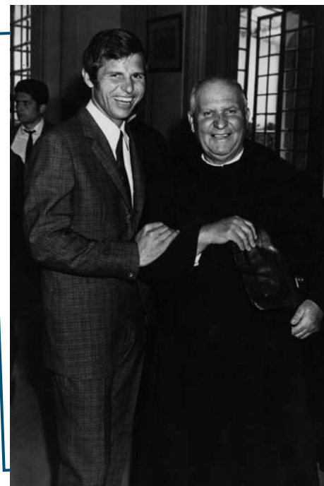
El Hno. Bonifacio con el famoso torero El Cordobés.

Enterado que había tenido -el famoso diestro de Palma del Río, Manuel Benítez Pérez, "El Cordobés", afamado torero como ninguno-, una fiesta para celebrar sus tiempos buenos, allá se fue, y estando entre ellos, extrañados y alegres de verle aparecer, tomó la cartera y la levantó a modo de brindis, saludando así en voz alta: "Paisanos del Cordobés, Mano-