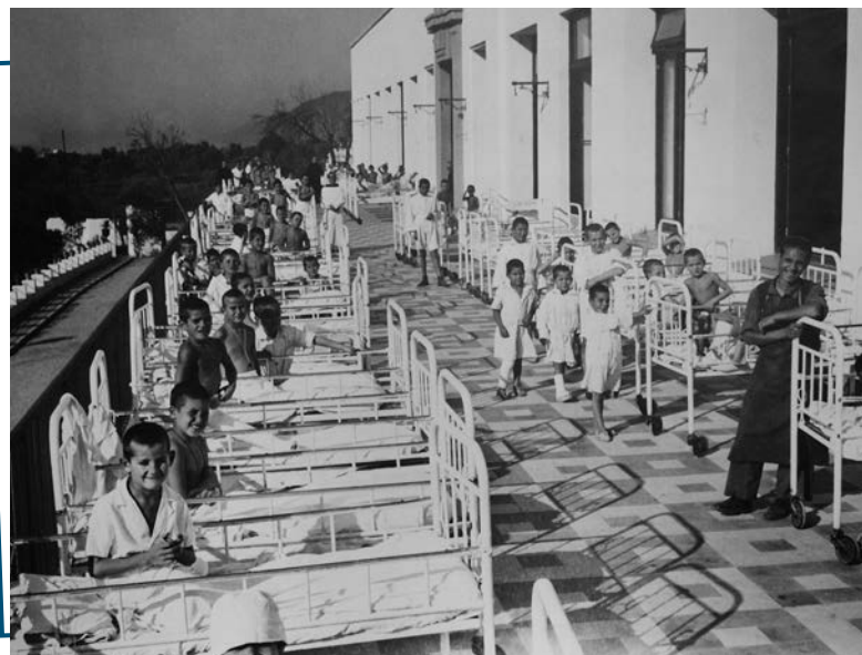
Terraza de la Clínica San Rafael, Córdoba.