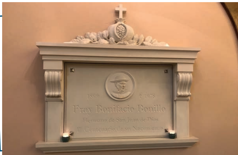
Tumba del Siervo de Dios en la Iglesia del Hospital San Juan de Dios de Córdoba, después del traslado en 1999.