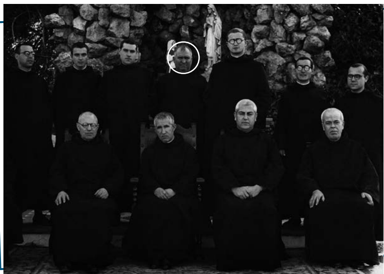
Comunidad de Córdoba 1948.

Poco a poco se gana la simpatía de muchas personas que reconocen su entrega por los demás. En épocas de recolección, visita todas las fincas: trigo, garbanzos, aceite, aceitunas, uvas, vino, almendras, pavos, gallos, todo viene bien. Incluso viendo la buena actitud del Hermano, le decían: "si consigue atrapar ese animal, puede llevárselo" . Y allá corría, con su hábito, hasta atraparlo. Y lo conseguía. No reparaba en medios.