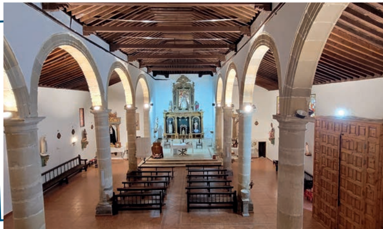
Interior de la iglesia Nuestra Señora de la Paz.