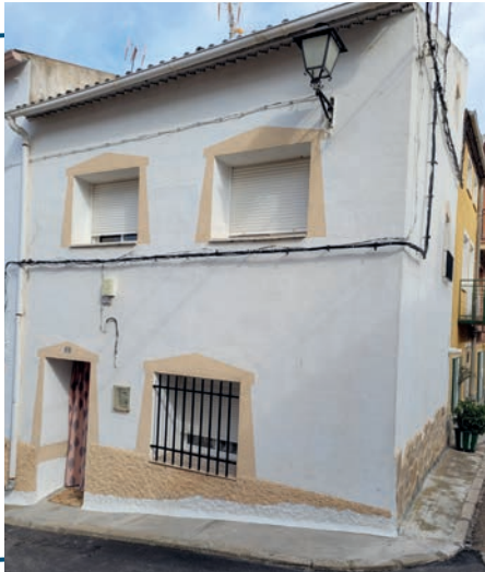
La casa donde nació el Siervo de Dios.