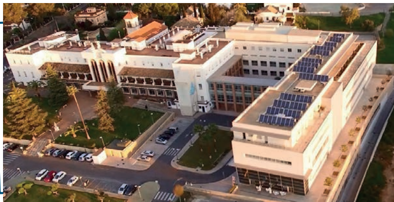
El Hospital San Juan de Dios de Córdoba.