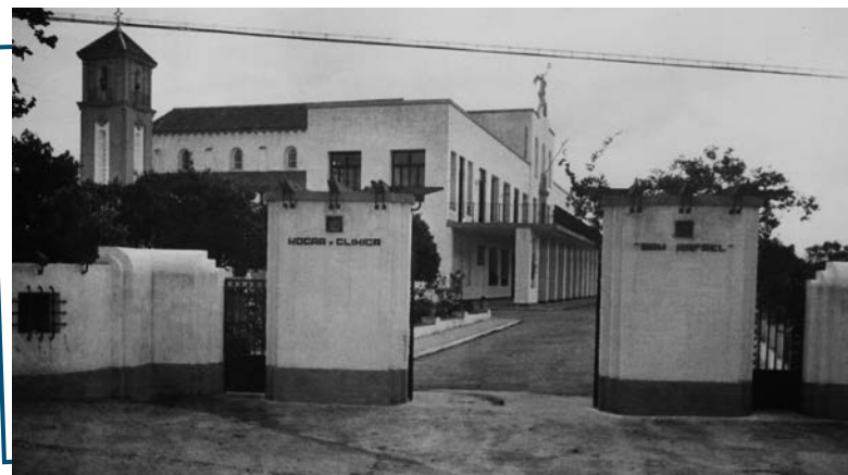
Clínica San Rafael, Córdoba.

Crean la Asociación Unión de Damas Pro-Hogar y Clínica San Rafael, para la fundación y el sostenimiento benéfico destinado a la curación de los niños lisiados pobres. Y, a pesar de las dificultades