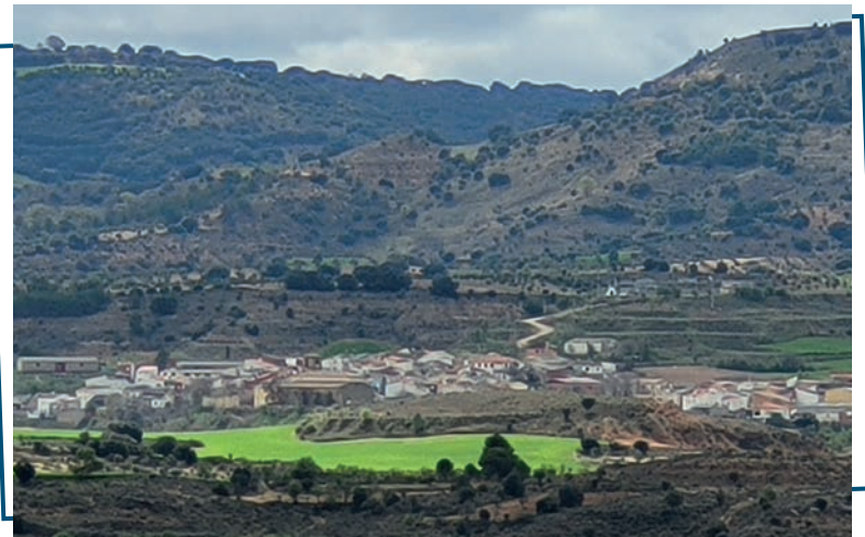
Cañaveruelas, el pueblo natal del Siervo de Dios.