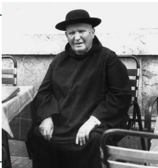
El Siervo de Dios espera encontrarse con sus bienhechores.

Conocía bien su campo de trabajo limosnero. Se informaba de todo lo referente a los bienhechores. Si alguien vendía alguna finca o compraba algo importante, sabía decirle: “¿Qué buena venta ha hecho, ¿por qué no me da algo para mis niños?” . Igualmente, si tenían mejor cosecha. Y así lo hacía visitando a los toreros después de las corridas. También iba a alguien afortunado con la lotería u otra clase de juegos. Les felicitaba y luego les pedía la parte para