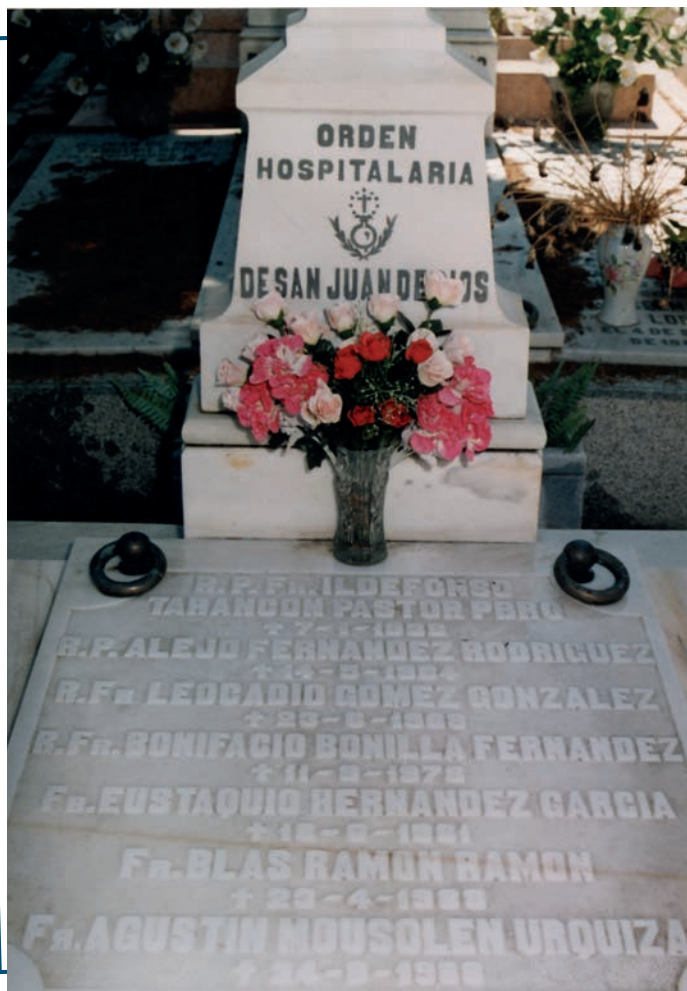
Tumba de los Religiosos donde fue enterrado el Siervo de Dios.

depositándose en el panteón de los Hermanos de San Juan de Dios, en el patio principal del mismo. Y desde el cielo llegan las alentadoras palabras de Jesús: "Ven, bendito de mi Padre, porque tuve hambre y me diste de comer, tuve sed y me diste de beber, estuve enfermo y me visitaste".